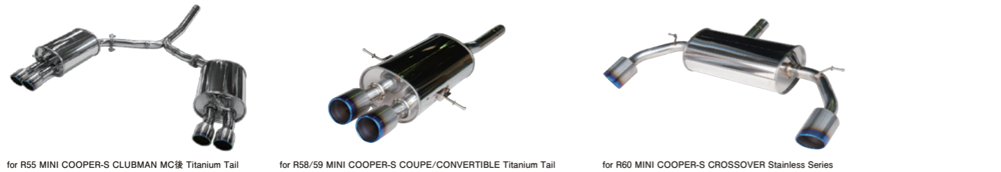
for R55 MINI COOPER-S CLUBMAN MC後 Titanium Tail