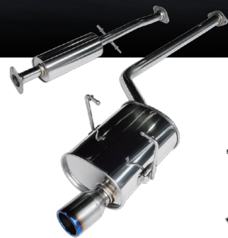
for R50 MINI COOPER Titanium Tail