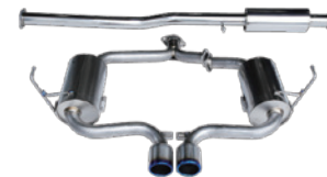
for R53 MINI COOPER-S Titanium Hybrid