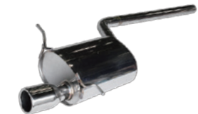
for R56 MINI COOPER-S Stainless Series