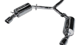
for R55 MINI COOPER-S CLUBMAN Stainless Series