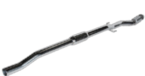
for R56 MINI COOPER-S Center Pipe