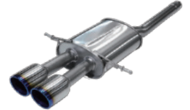
for R56 MINI COOPER-S Titanium